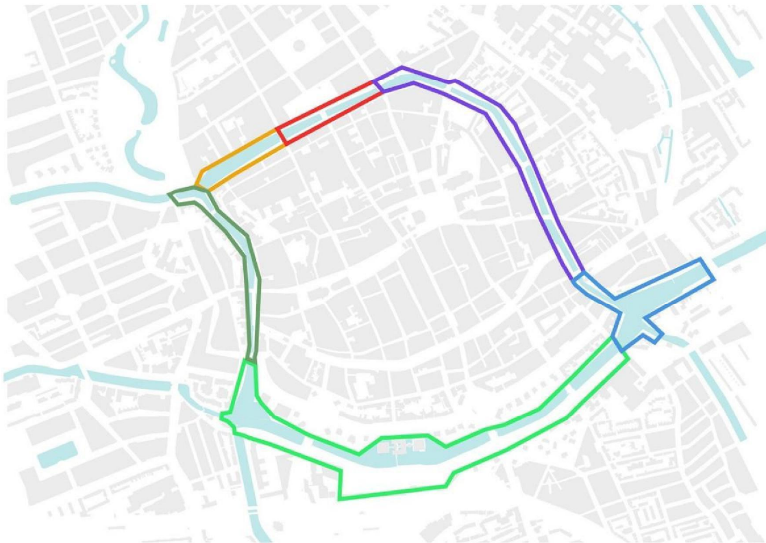
Afb. 3. Eerste aanzet tot definiëring van deelgebieden op basis van ontstaan, uiterlijk en gebruik